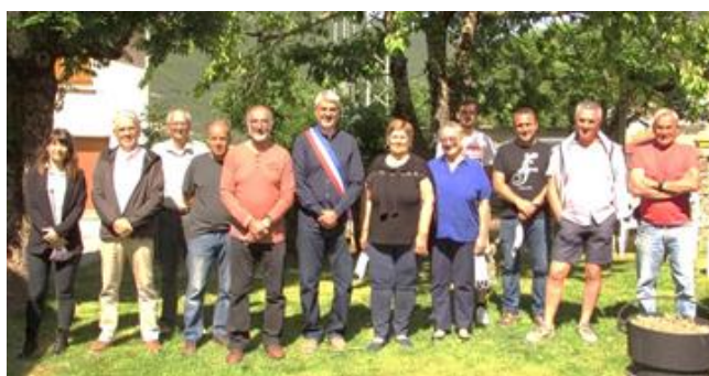
LE NOUVEAU CONSEIL MUNICIPAL