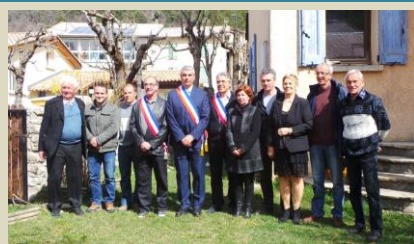
LE CONSEIL MUNICIPAL