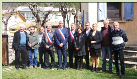
LE CONSEIL MUNICIPAL

Vœux du Maire – 18 h 00 Salle des Fêtes de la Mairie