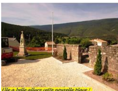
Elle a belle allure cette nouvelle place !

Puis, en 2016, le Conseil Municipal à l'unanimité, décidait de sortir ce monument du cimetière, pour consacrer une place dédiée au souvenir de tous ceux et celles qui ont donné leurs vies pour la Patrie.